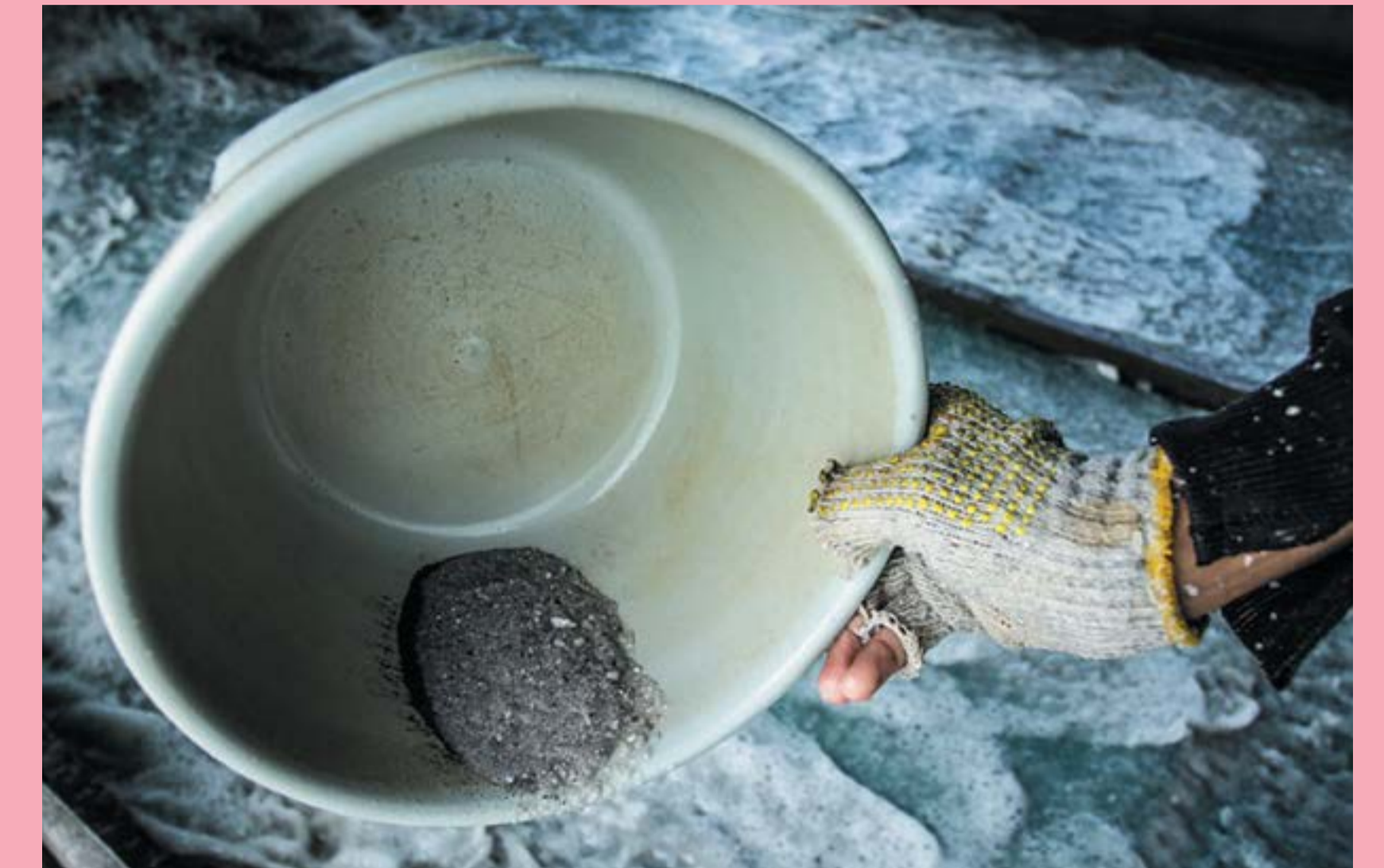
Een arbeider die in Belitung tin wint.

Tin is een grondstof die we nog steeds dagelijks gebruiken zonder het door te hebben. Wist je dat er in één smartphone al 2 gram tin zit? Ook is tin verwerkt in computers, televisies maar ook blikjes bier bijvoorbeeld. Het is een van de oudste metalen die we kennen.