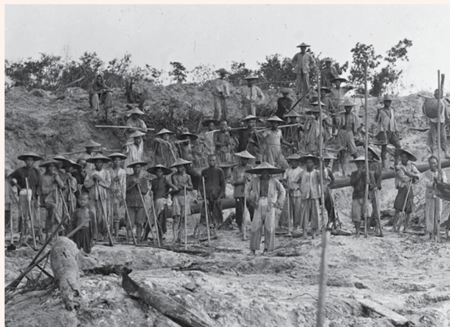
Chinese arbeiders in een tinmijn, collectie Koninklijk Instituut voor Taal-, Land- en Volkenkunde.

De Billiton Maatschappij maakte gebruik van Chinese en Javaanse contractarbeiders. Zij werkten vaak tegen hun wil. Onder gevaarlijke omstandigheden werkten zij lange dagen voor lage lonen. Velen werden mishandeld en stierven als gevolg van hun werkzaamheden in de mijnbouw aan ziektes. De Maatschappij kwam geregeld onder vuur te liggen. Zo werd in 1908 een onderzoek uitgevoerd naar de slechte arbeidsomstandigheden. Na de onafhankelijkheid werden de activiteiten van de Billiton Maatschappij genationaliseerd door de Indonesische regering. In de jaren vijftig verliet de onderneming het land, maar Indonesië bleef actief in de tinindustrie. Na verschillende overnames fuseerde de onderneming begin 21 e eeuw tot BHP Billiton, tegenwoordig een van 's werelds grootste bedrijven.