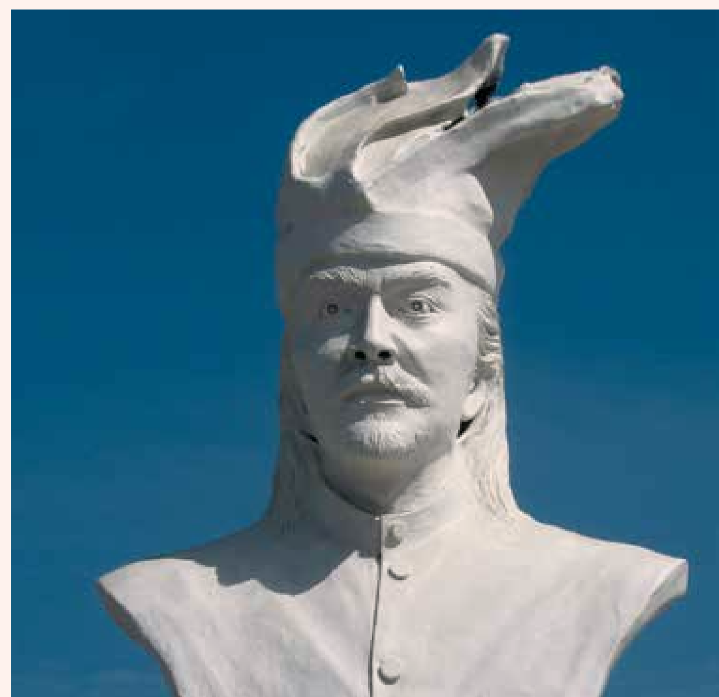
Standbeeld van de Sultan Hasanuddin.

Zij werden als slaafgemaakten verkocht. De inzet van oorspronkelijke bewoners en het uitspelen van koningen en sultans ten behoeve van het koloniale project was een veelgebruikte verdeel-en-heers tactiek van Nederlandse koloniale machthebbers. Uiteindelijk verloor het sultanaat Gowa in 1669 zijn onafhankelijkheid en werd Makassar met geweld geannexeerd door de VOC. Echter was er altijd anti-koloniaal verzet tot en met het einde van de Indonesische onafhankelijkheidsstrijd in 1949.