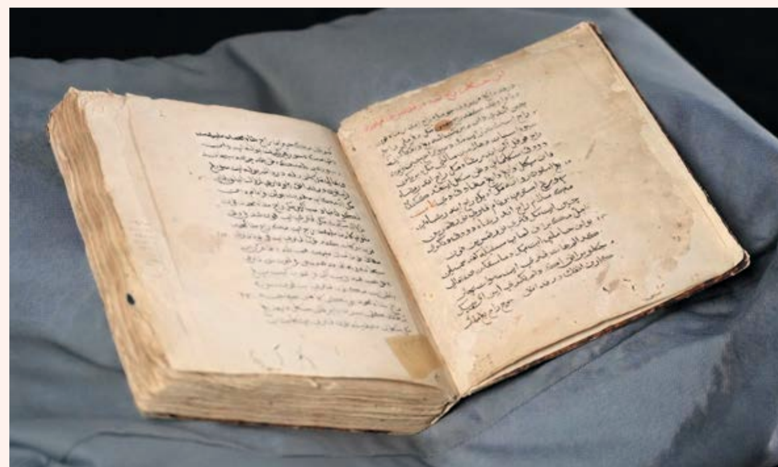
Een 17 e eeuws Acehs manuscript, bron Universiteitsbibliotheek Leiden.

Hieronder een 17 e eeuws manuscript dat vertelt over de oorspronkelijke geschiedenis van het sultanaat. Vol verhalen over het leven en gebruiken aan de Acehse hoven, relaties met onder andere Portugal, China en Turkije, oorlogen en de Islamitische religie. Met slechts drie overgeleverde manuscripten is de Hikayat Aceh zeer zeldzaam en een belangrijke bron voor mensen met interesse in de Islam, internationale betrekkingen en de geschiedenis van Aceh. Twee manuscripten worden beheerd door de Universitaire Bibliotheken Leiden die ze heeft gedigitaliseerd en vrij beschikbaar stelt en één manuscript door de Nationale Bibliotheek van Indonesië. Het is niet bekend of de manuscripten ook naar Aceh gaan.