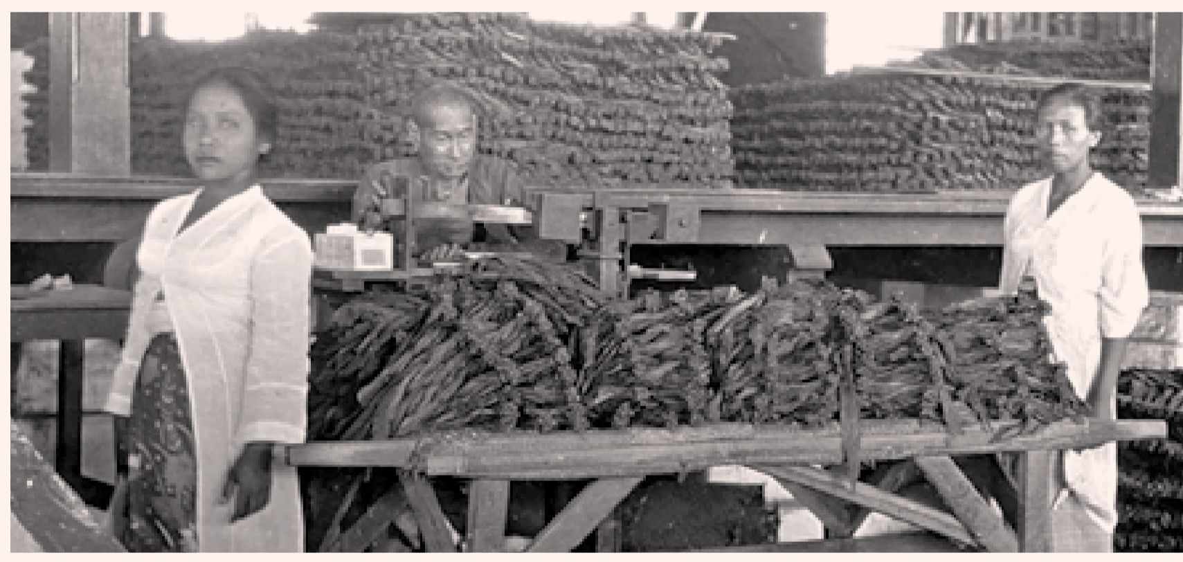
Twee vrouwen verplaatsen de zojuist binnengekomen tabaksbladeren, ca. 1910-1920, Belawan, Noord-Sumatra

Tot slaafgemaakten werden uit verschillende delen van Indonesië en de omliggende regio's gehaald om op de plantages te werken. Niet alleen mannen, maar ook jonge vrouwen werden gedwongen tewerkgesteld. Na de afschaffing van de slavernij in toenmalig Nederlands-Indië in 1860 werd gebruik gemaakt van contractarbeiders die 'koeli' werden genoemd. Om een constante arbeidskracht te waarborgen, werd in 1880 de eerste zogeheten 'Koelie-Ordonnantie' ingevoerd. Eerst op Sumatra, maar later ook in de rest van voormalig Nederlands-Indië. Hierbij kregen Europese planters bij wet verregaande macht over de werkers. Zo konden zij hen bestraffen zonder tussenkomst van de rechtbank en waren zij zowel politie als rechter. Ondanks het gevaar voor eigen leven, kwamen werkers ook vaak in verzet tegen de onrechtvaardige en wrede omstandigheden op de plantages.